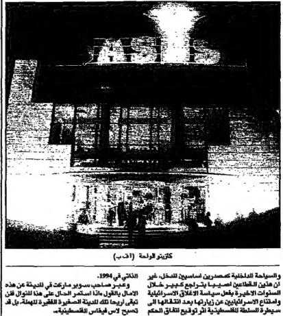
الكازينو في اريحا

الثلاثاء، للتعبير عن كل ما عاينوه من الكازينو. وهم يصفون الكازينو بأنه "منارة" في حياة اريحا، حيث بدأ سكانها في العودة للعمل في الشركات المحلية، وفتحوا العديد من المحلات التجارية، وفتحوا العديد من المطاعم والفنادق. وقال مدير الكازينو: "الكازينو ليس فقط مكان للترفيه، بل هو مكان للحياة، حيث بدأنا نرى حياة تعود الى اريحا، ونرى الناس يبتعدون عن المخيم ويتوجهون الى اريحا للترفيه والعمل".